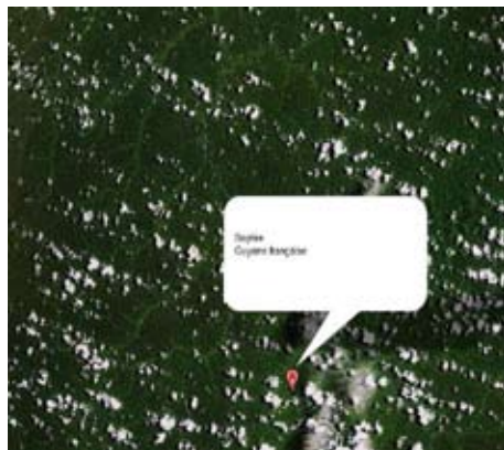
Sophie (Guyane française)