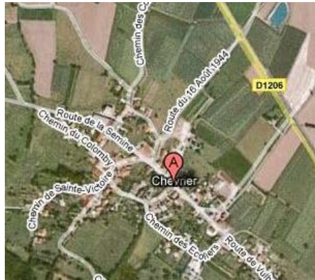
Chevrier, Pers-Jussy (74)